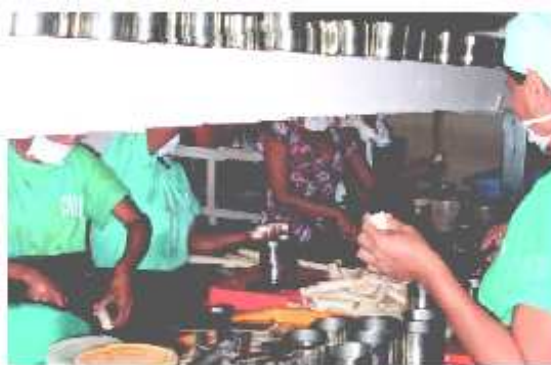
Planta Piloto - FIIA