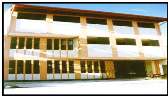
Oficina General de Extensión y Proyección (calle Loreto 6° cuadra)

La Extensión y Proyección social se desarrolló a través de la Oficina General de Extensión y Proyección y la Direcciones de Extensión y Proyección de las Facultades Académicas las que están encargadas de organizar la difusión de la cultura general y estudios de carácter técnico y profesional, y de establecer relaciones culturales, sociales y económicas con fines de cooperación y asistencia.