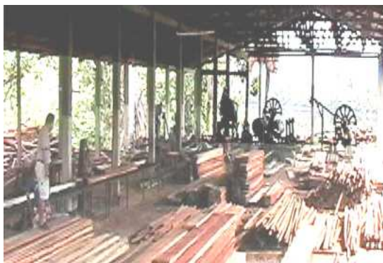
Aserradero Puerto Almendras – FCB

El funcionamiento de las plantas pilotos que operan como “Centros de Producción, Investigación, Experimentación o Enseñanza Universitaria” y la potenciación de los que solo son viables y que garantizan su productividad y permanencia en el mercado, han permitido promover la difusión y la transferencia de la producción académica, científica, tecnológica y cultural de la Universidad Nacional de la Amazonía Peruana, hacia la comunidad, mediante la participación de los docentes, alumnos y administrativos en trabajos destinados a la producción de bienes o prestación de servicios.