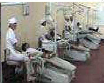
Clínica Estomatológico Dental - FO