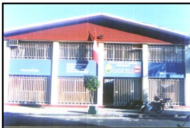
Oficina General de Bienestar Universitario (Calle Nanay 3° cuadra)

El Bienestar Universitario es desarrollado por la Oficina General de Bienestar y Facultades Académicas las que están encargadas de prestar servicio médico asistencial mediante el autoseguro estudiantil y brinda alimentación a través del comedor universitario priorizando la atención de los estudiantes de bajo nivel socio-económico y de buen rendimiento académico. Estos servicios también se orientan al personal docente, no docente y a la comunidad.