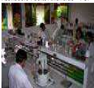
Laboratorio Análisis Clínico – FCB