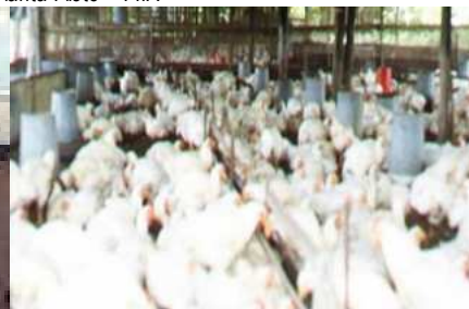
Centro de producción aves - FA

Los centros de producción son unidades confortantes de la estructura organizativa de las facultades académicas; se consideran como unidades desconcentradas por cuanto estas se constituyen como centros captadores de recursos económicos, por la venta de bienes o prestación de servicios que se producen en estos centros, como resultados de los trabajos de campo de los estudiantes o de investigaciones. Así mismos en estos centros de producción se desarrollan las horas prácticas de las asignaturas o prácticas pre profesionales de los estudiantes.