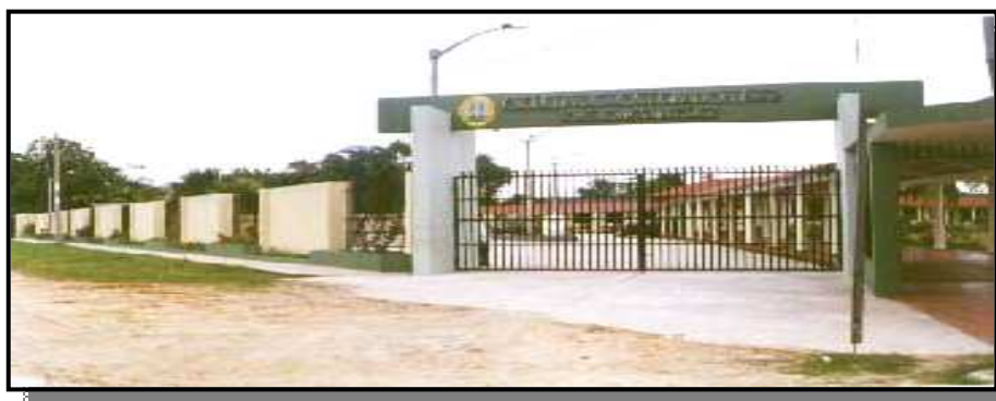
Escuela de Post Grado de la UNAP (Calle Los Rosales S/N)

El año académico 2009 ha sido de desarrollo y consolidación para la Escuela de Post Grado, pues se ha logrado regularizar y articular las actividades de Post Grado distribuidas en ocho de catorce Facultades.