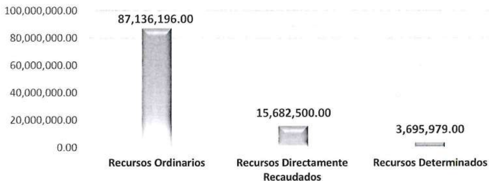
GRÁFICO 2: PRESUPUESTO INSTITUCIONAL DE APERTURA - UNAP AÑO FISCAL 2022 POR FUENTE DE FINANCIAMIENTO (EN SOLES)

El Cuadro N° 02, muestra el PIA de Gastos, distribuido por Fuente de Financiamiento, de los cuales, S/ 87,136,196 corresponde a Recursos Ordinarios (81.81% del PIA), S/ 15,682,500 a Recursos Directamente Recaudados (14.72% del PIA), y S/ 3,695,979 a Recursos Determinados (3.47% del PIA).