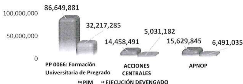
GRÁFICO 5: EJECUCIÓN DEL GASTO POR CATEGORÍA PRESUPUESTAL - UNAP AÑO FISCAL 2022 - PRIMER SEMESTRE POR TODA FUENTE DE FINANCIAMIENTO (EN SOLES)