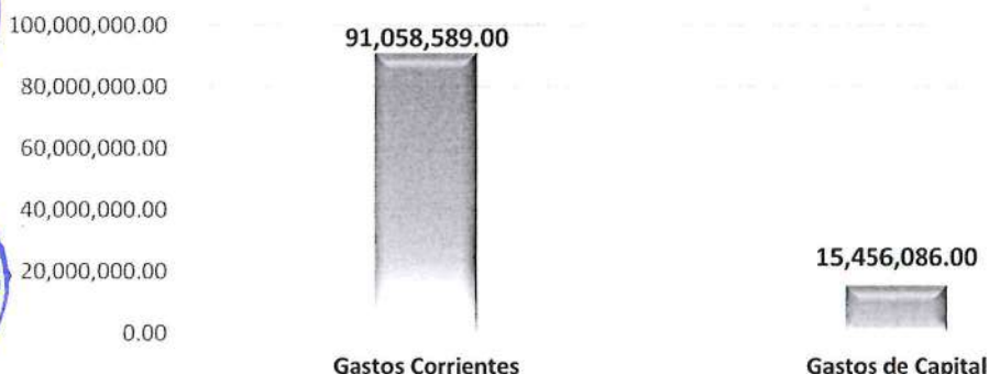
GRÁFICO 1: PRESUPUESTO INSTITUCIONAL DE APERTURA - UNAP AÑO FISCAL 2022 POR TIPO DE GASTO (EN SOLES)

El Cuadro N° 01, muestra el Presupuesto Institucional de Apertura (PIA) de Gastos aprobado para el Año Fiscal 2022, por un monto de S/ 106,514,675 en consistencia con el Plan Operativo Institucional, distribuido por Tipo de Gasto , de los cuales, para Gastos Corrientes corresponde un monto de S/ 91,058,589 y S/ 15,456,086 para Gastos de Capital , representando el 85.49% y 14.51% respectivamente, respecto al Presupuesto Total de Apertura.