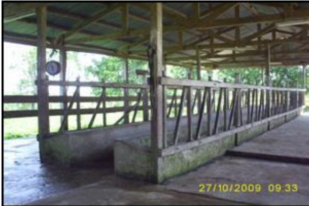
SALA DE ORDEÑO