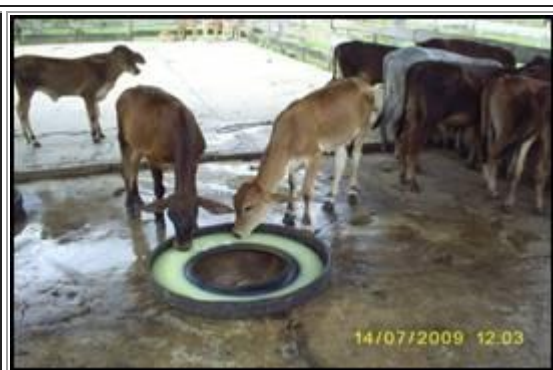
ÁREAS DE PASTOREO