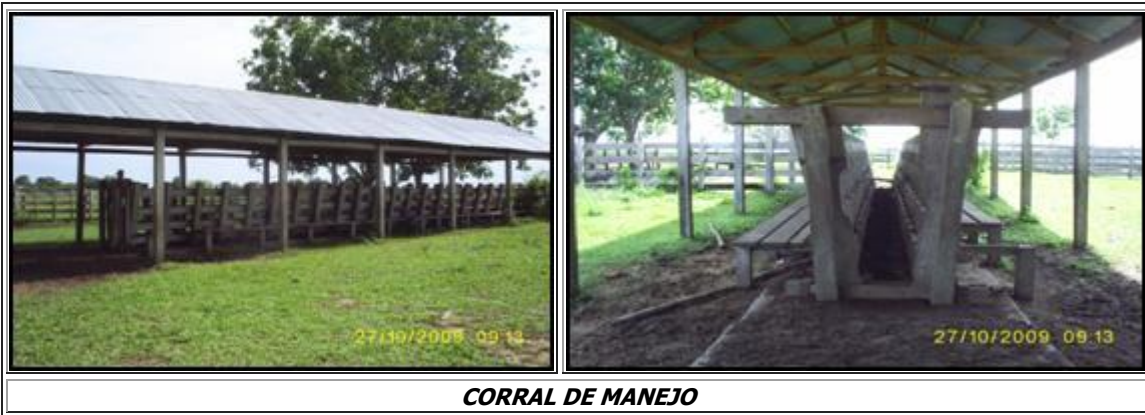
CORRAL DE MANEJO