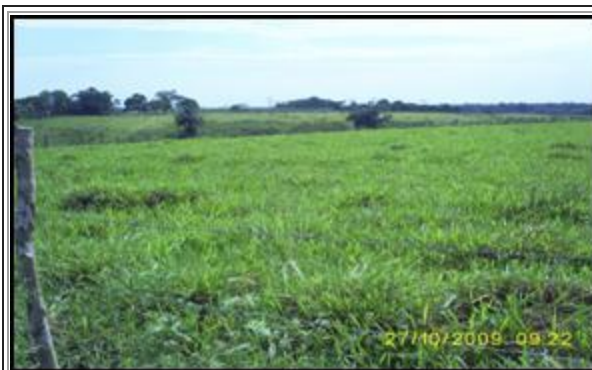
CORRAL DE RECRÍA

Actualmente nuestro Centro Ganadero, cuenta con instalaciones tales como: Establo lechero (sala de ordeño), corral de manejo, corral de recría y áreas de pastoreo, instalaciones de pasturas (pasto de corte, y para pastoreo).