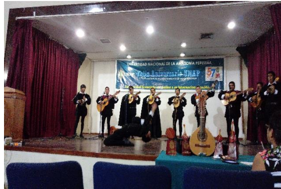
Universidad Nacional de Ingeniería - Lima