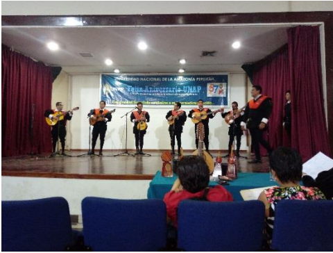
Facultad de Adm. De la Universidad de San Martín

Fecha : Sábado 22 de junio de 2019 Hora : 7.00 pm Lugar : Aula Magna de la UNAP N° Beneficiarios: 250