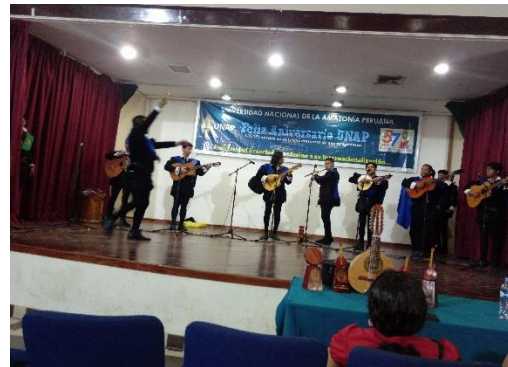
Universidad Peruana de las Américas