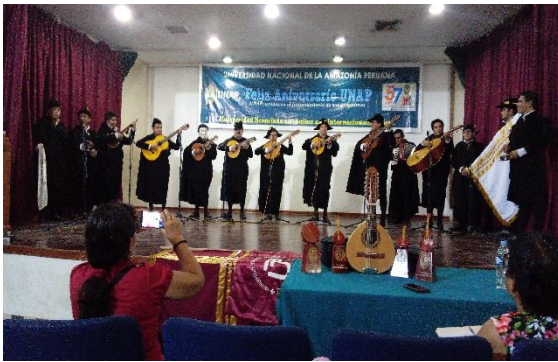
Universidad Tecnológica del Perú