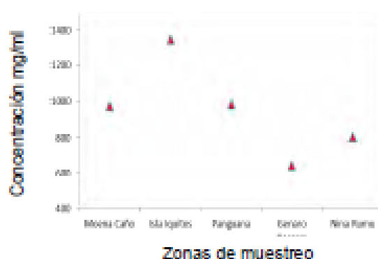
Figura 2. Cuantificación de proteínas del veneno de Bothrops atrox de diferentes zonas geográficas.

presentó la menor cantidad de proteínas, los individuos de Moena Caño, Nina Rumi y Panguana, mostraron cantidades medias de proteínas.